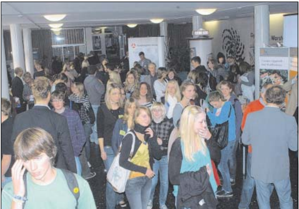
Großes Interesse: Die Schüler tummelten sich vor den vielen Ständen und nahmen jede Menge Informationsmaterial mit nach Hause.

ge an den Ständen hatten die Schüler aber auch Gelegenheit, Vorträgen aus Wirtschaft und Industrie zu lauschen. In den Klassenräume präsentierten Vertreter aus verschiedenen Firmen ihr Berufsbild und ihren Werdegang.