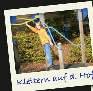
Klettern auf d. Hof