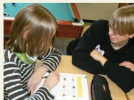
Hilfe beim Lernen