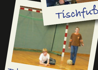
Toben in d. Turnhalle