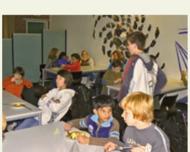
Essen im Forum

Es ist schon eine Menge los bei uns im 13+ Projekt, oder????