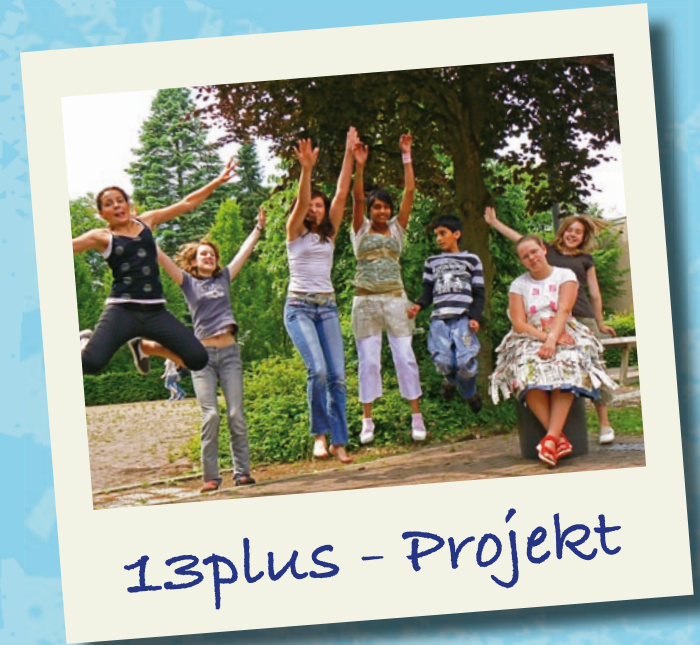
13plus - Projekt

Meine Hausaufgaben werden hier kontrolliert.... und ich habe Billard und Rummikub spielen gelernt.